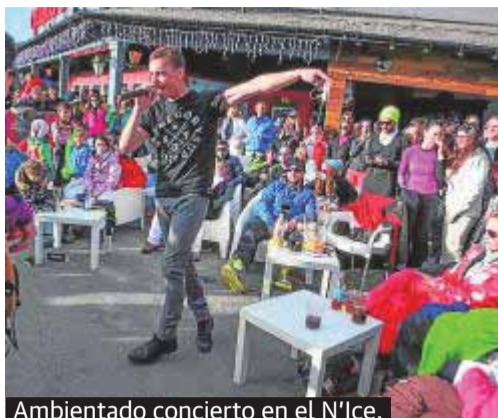
Ambientado concierto en el N'Ice.