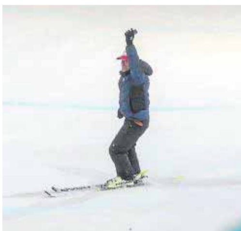
Un técnico recogió un móvil caído al halfpipe.