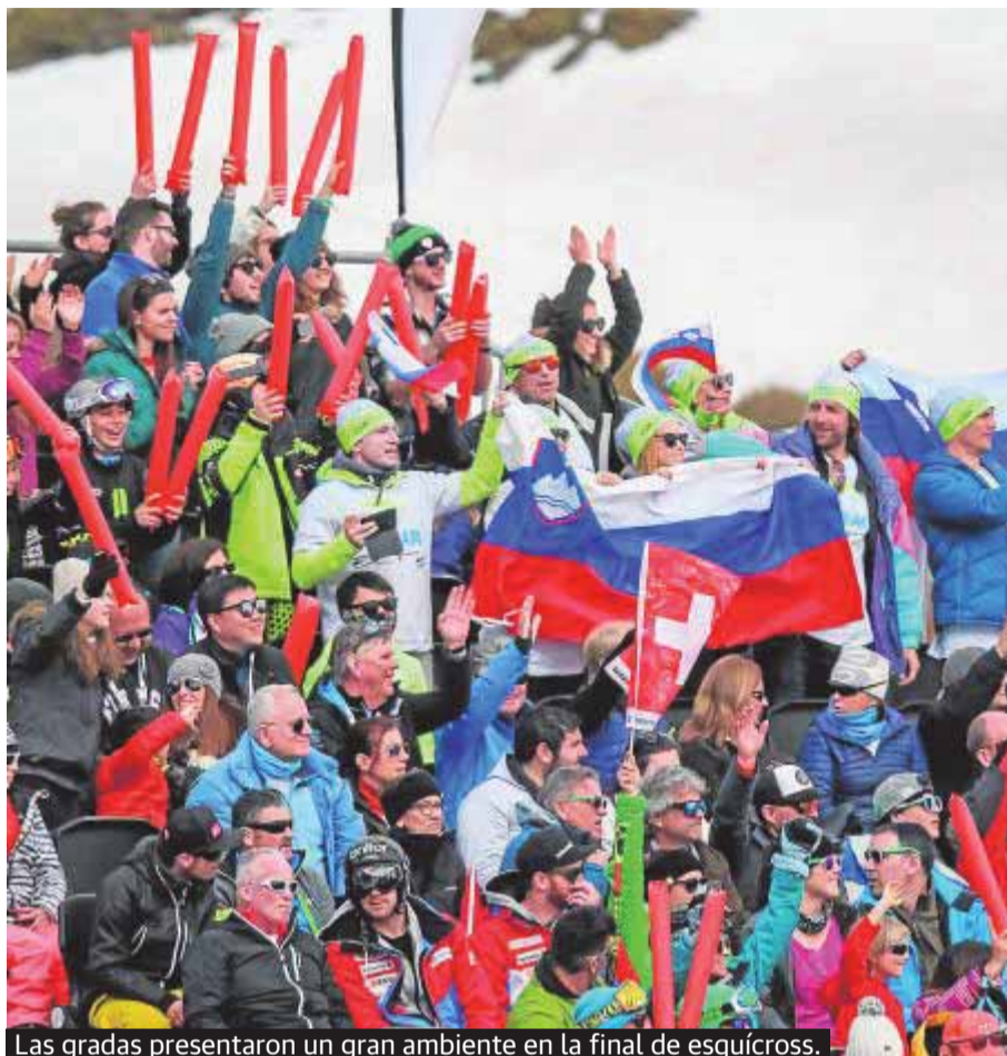
Las gradas presentaron un gran ambiente en la final de esquícross.