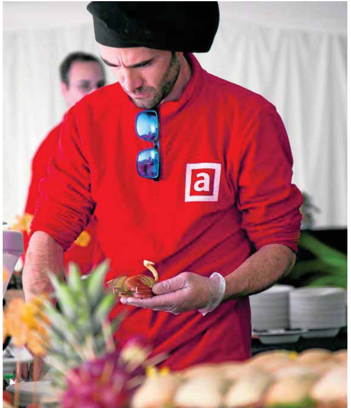
Se necesita mucha organización y habilidad para servir en un gran evento como este. :: GRUPO ABADES

Ensalada, pasta, pescado, carne, guarnición y postre componen estos menús que se dividen en 'islas' con especificaciones del tipo de alérgenos para que cada cual tenga claro qué come, dentro de lo que su estilo de vida le permite comer.