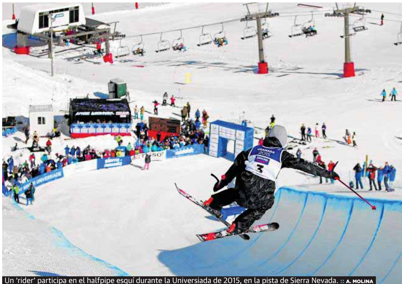
Un 'rider' participa en el halfpipe esquí durante la Universiada de 2015, en la pista de Sierra Nevada.

Las modalidades más espectaculares del llamado 'free ski' pondrán el broche de oro a los campeonatos, que celebrarán su ceremonia de clausura mañana al mediodía