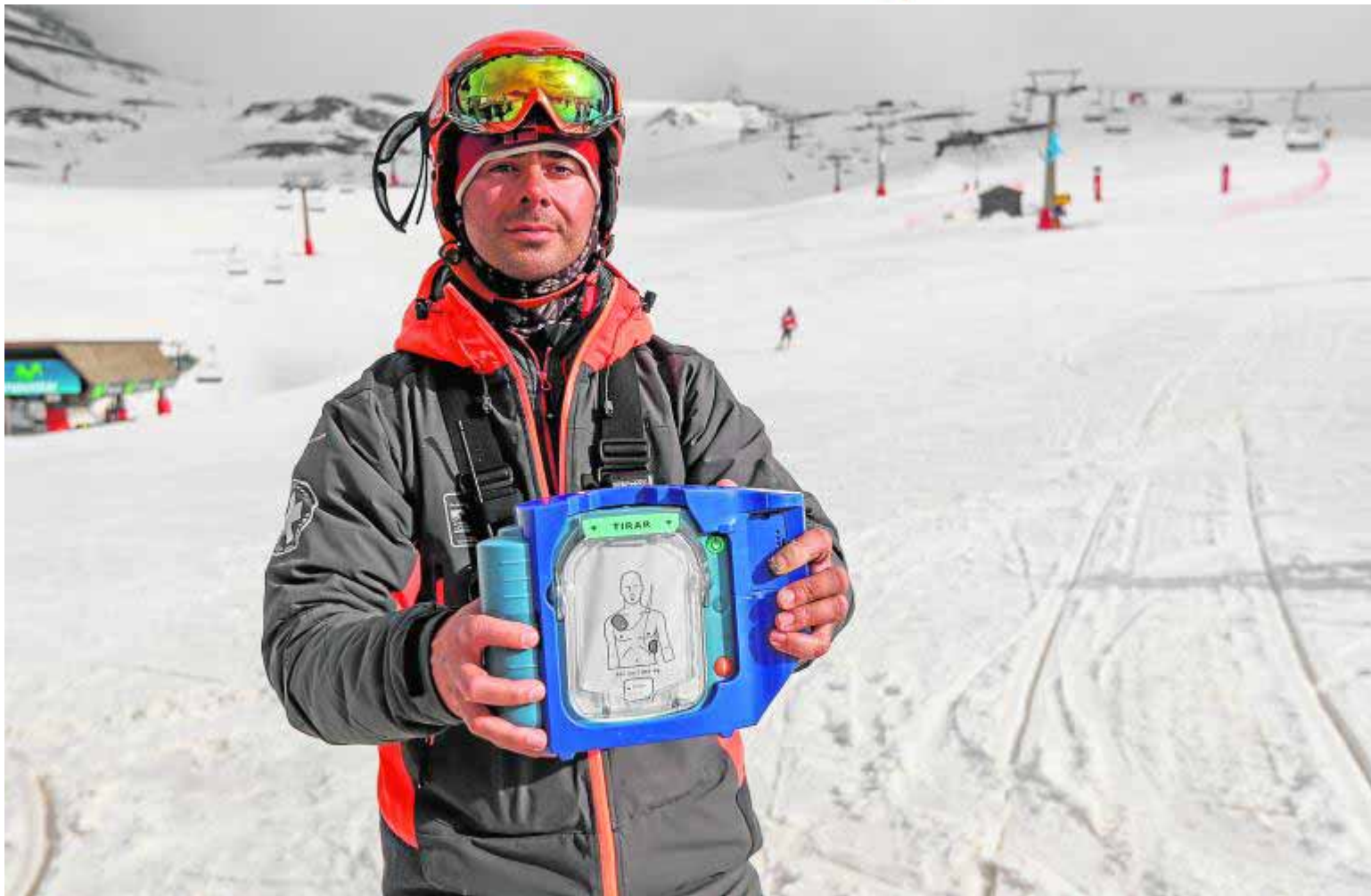
Los pisteros están perfectamente formados para manejar los desfibriladores en caso de ser necesario.