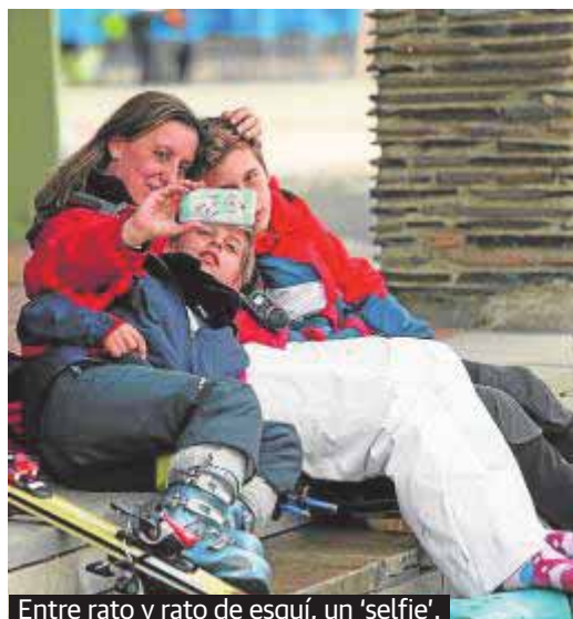
Entre rato y rato de esquí, un 'selfie'.