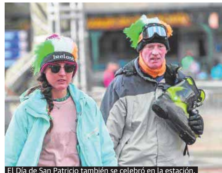
El Día de San Patricio también se celebró en la estación.