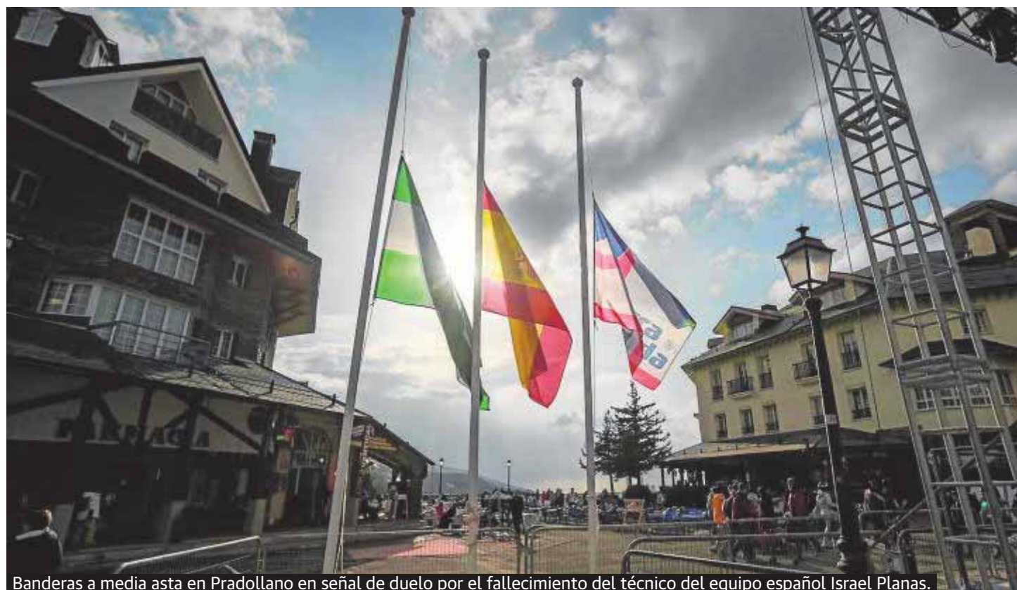
Banderas a media asta en Pradollano en señal de duelo por el fallecimiento del técnico del equipo español Israel Planas.