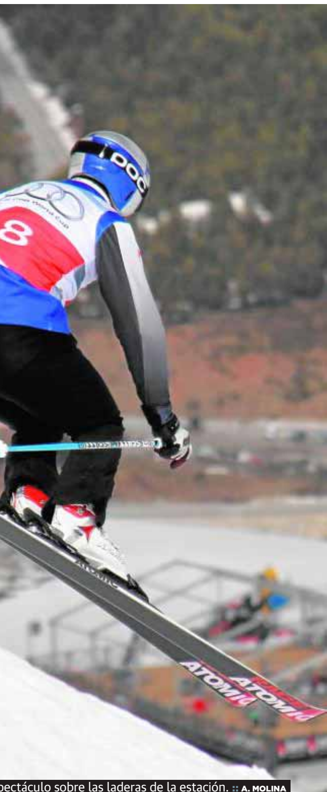
Espectáculo sobre las laderas de la estación. :: A. MOLINA

nia de clausura en el mismo área de meta en el que ya se ha vivido, entre otras cosas, la celebración de dos medallas de plata para los deportes de invierno españoles. Así las cosas, serán los deportes del llamado 'free' los que pongan el broche de oro al evento que ha proyectado a Sierra Nevada mundialmente.