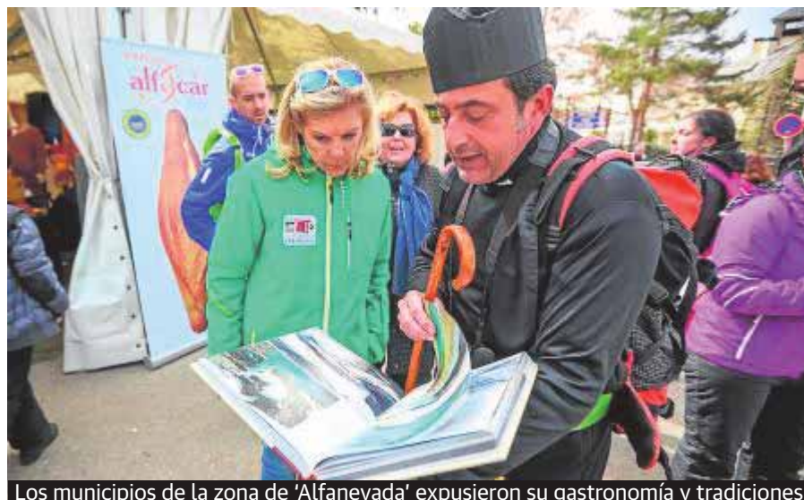
Los municipios de la zona de 'Alfanevada' expusieron su gastronomía y tradiciones.