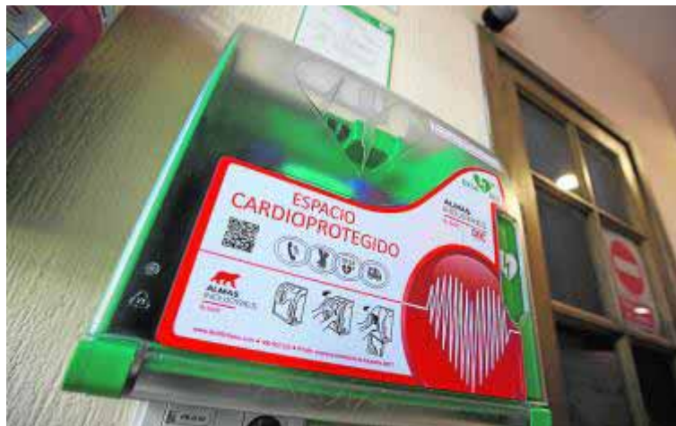
El desfibrilador instalado en el edificio de Cetursa.

Su principal diferencia con respecto al anterior equipamiento del que gozaba la estación radica en la disponibilidad de servicios de telecontrol, geolocalización, teleasistencia, asistencia verbal directa, alerta automática de socorro, centro de atención telefónica y mantenimiento 'in situ' las 24 horas del día. Equipos operacionales y conectados con el 112 y el 061, permitiendo el seguimiento a distancia y su localización.