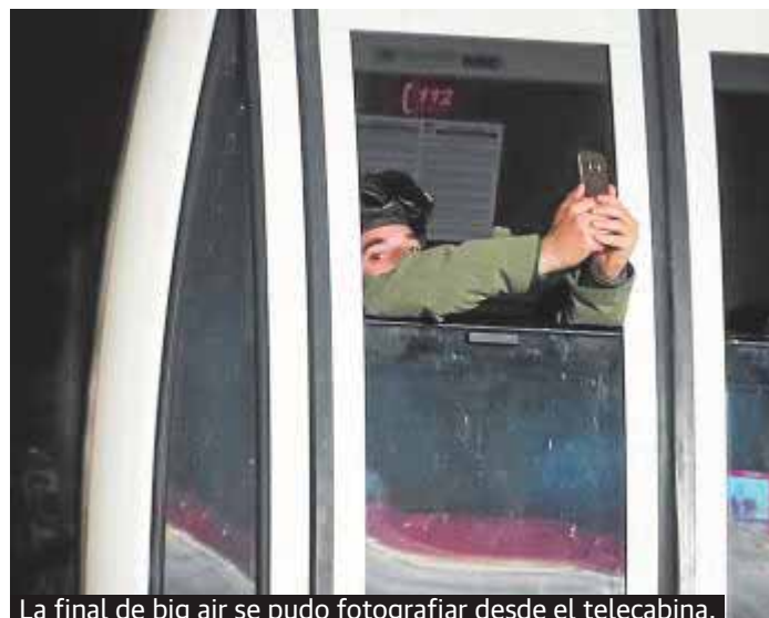
La final de big air se pudo fotografiar desde el telecabina.