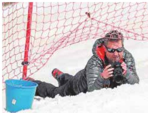
La mejor foto bien merece una gélida postura.