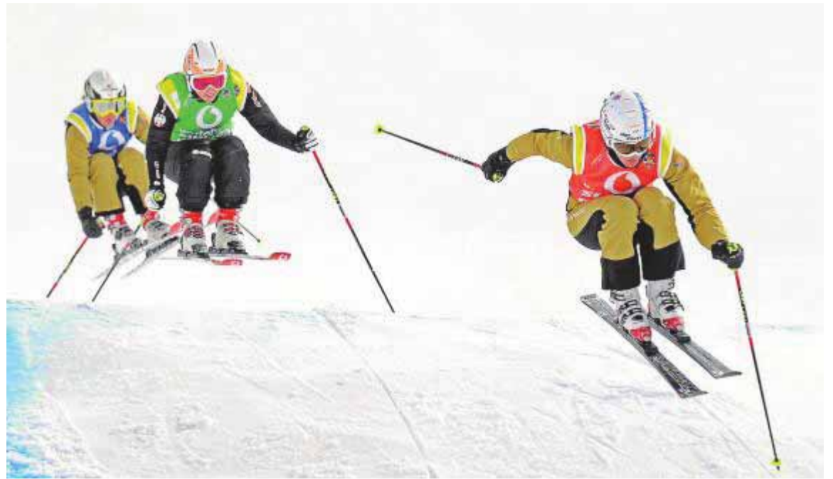
Descenso de la modalidad de esquí cross, en Sierra Nevada, en una imagen de archivo.

El esquí cross ha sido olímpico en Vancouver 2010 y Sochi 2014. La es-