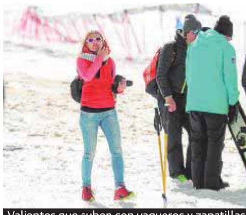
Valientes que suben con vaqueros y zapatillas.