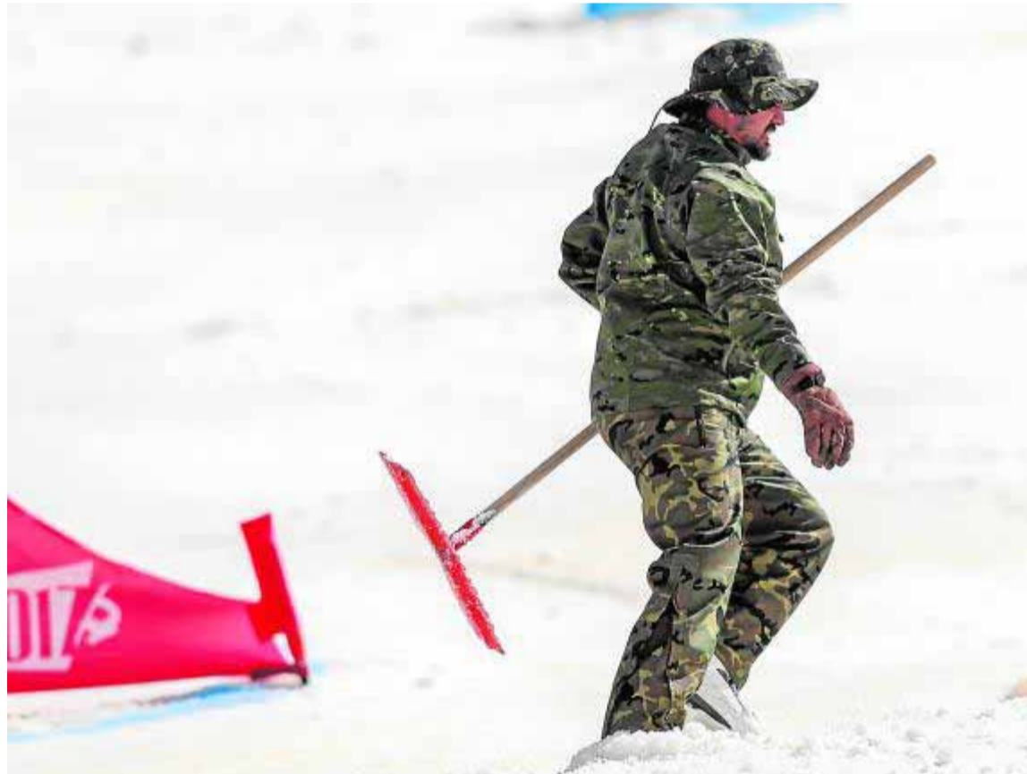
Un militar ayuda a acondicionar una de las pistas de los Mundiales