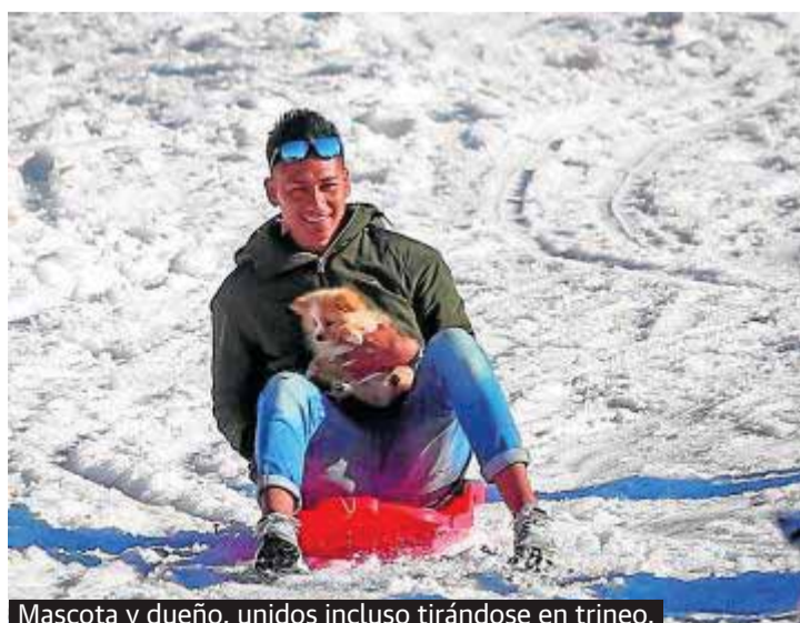
Mascota y dueño, unidos incluso tirándose en trineo.

Winter fun & games in the Sierra Nevada sunshine, ahead of snowfall forecasts