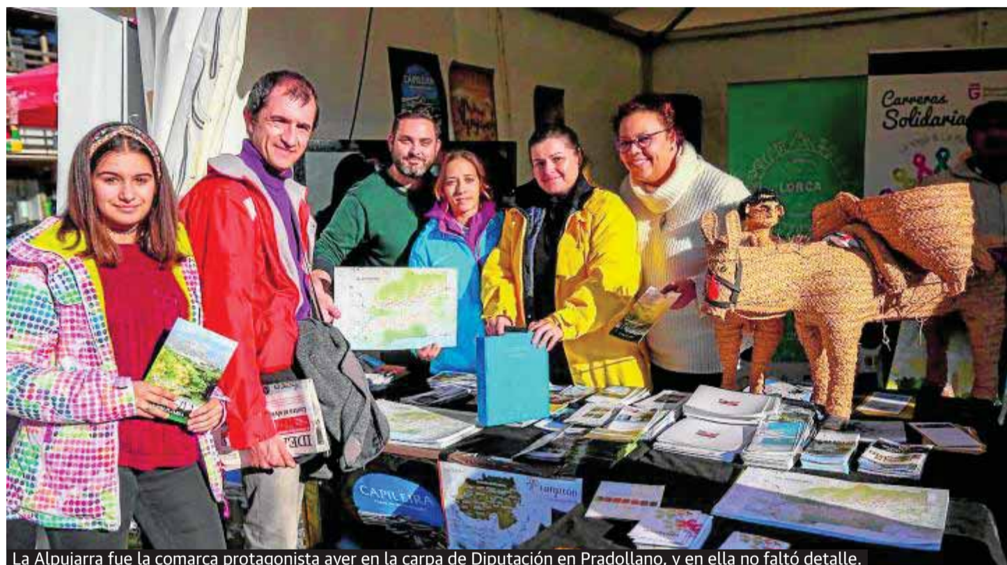
La Alpujarra fue la comarca protagonista ayer en la carpa de Diputación en Pradollano, y en ella no faltó detalle.