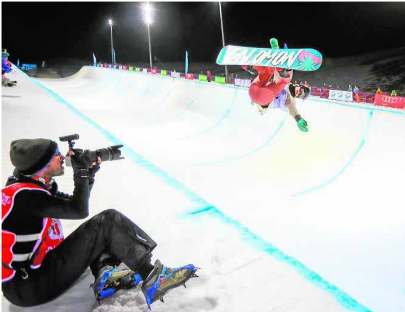
Alguien dijo una vez «si tu foto no es lo suficientemente buena es porque no te has acercado lo suficiente». :: FERMÍN R.