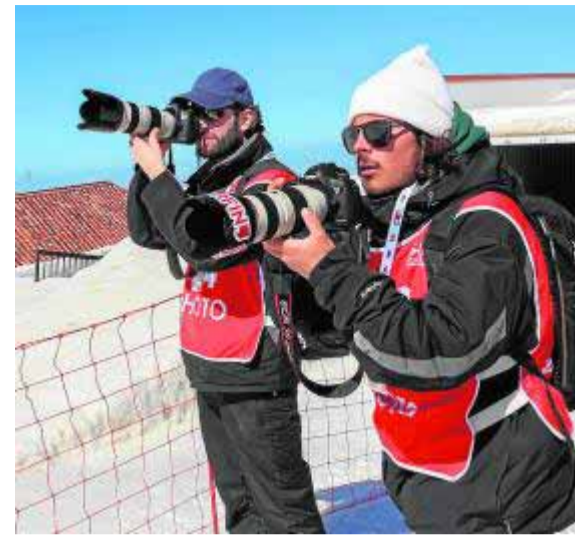
Es necesario estar atentos a cualquier truco.