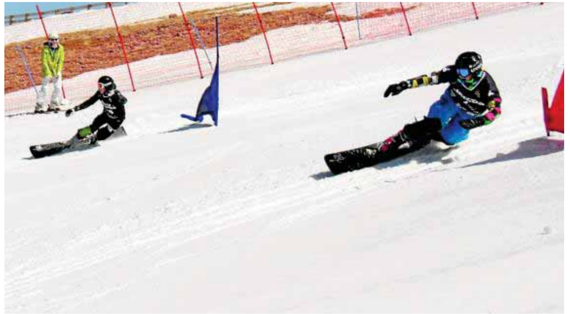
Los competidores bajan de dos en dos completando un recorrido simétrico. :: ALEJANDRO MOLINA

La diferencia entre el eslalom paralelo y el eslalom gigante paralelo se basa en la distancia entre sus puertas, más lejanas las unas de las otras en la modalidad 'gigante' permitiendo unas velocidades mayores. Esta distancia debe ser de entre 20 y 27 metros. Del mínimo de 18 puertas