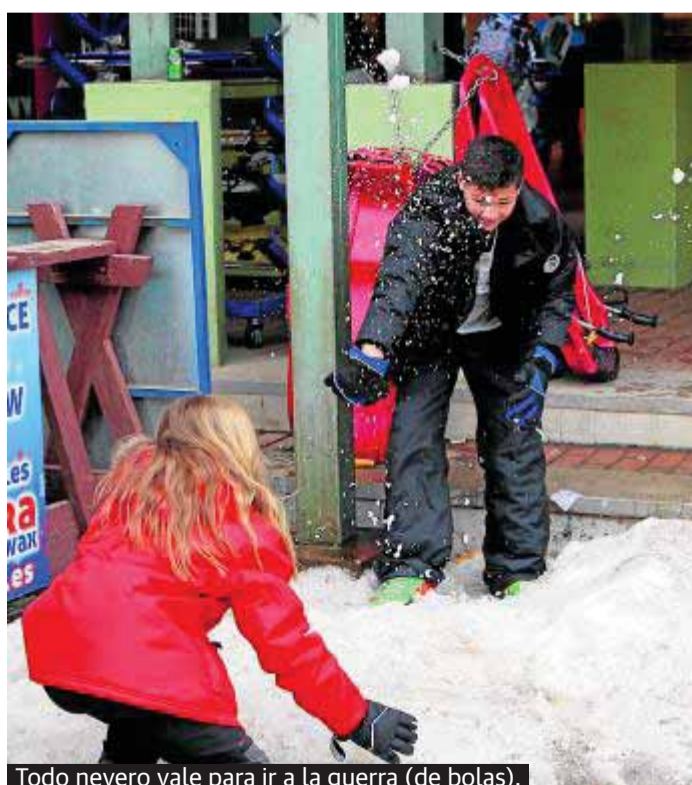
Todo nevero vale para ir a la guerra (de bolas).