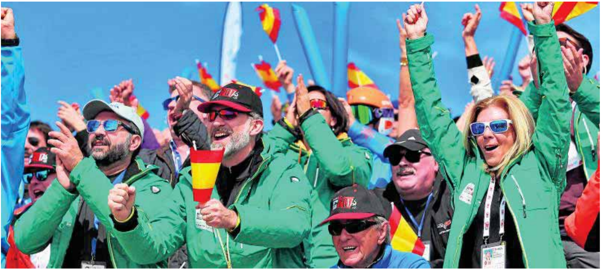
El Rey Felipe VI celebró como una aficionado más la medalla.