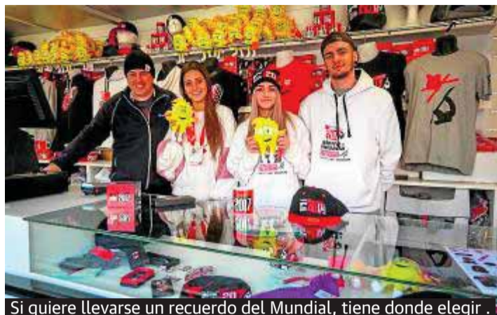
Si quiere llevarse un recuerdo del Mundial, tiene donde elegir .