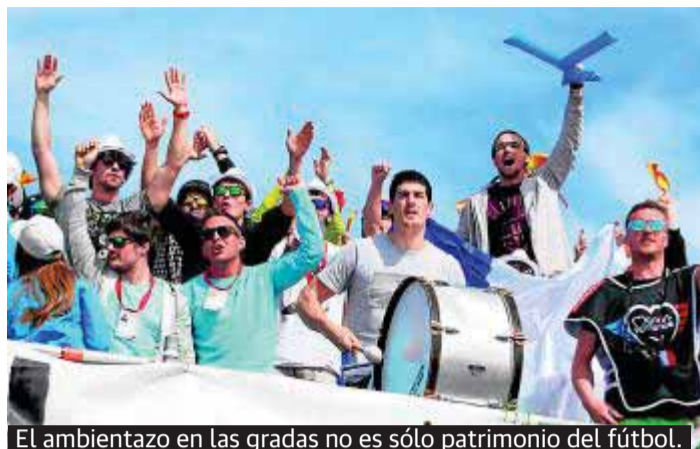
El ambientazo en las gradas no es sólo patrimonio del fútbol.