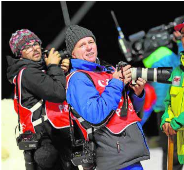
Los fotógrafos David Ramos (Getty) y Paul Hanna (Reuters).

Como no podía ser de otra forma, muchos fotógrafos granadinos han aprovechado la circunstancia del Mundial para demostrar su talento. Fermín Rodríguez, fotógrafo oficial