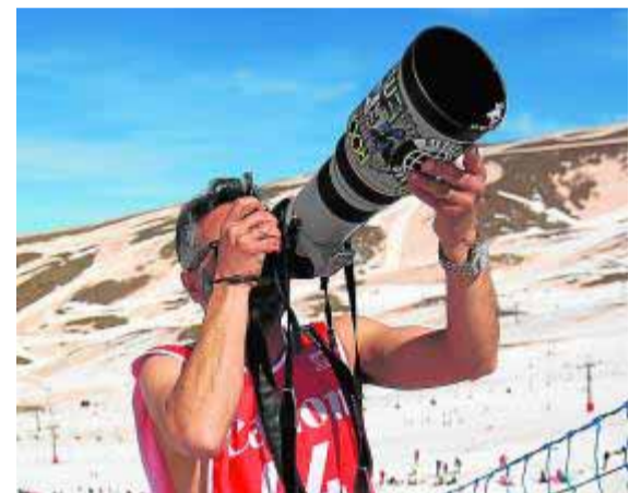
Cazando a los riders con los 'cañones'.

truco decisivo, en las finales estás obligado a situarte en las llegadas y las fotografías no son tan bonitas como en los entrenamientos».