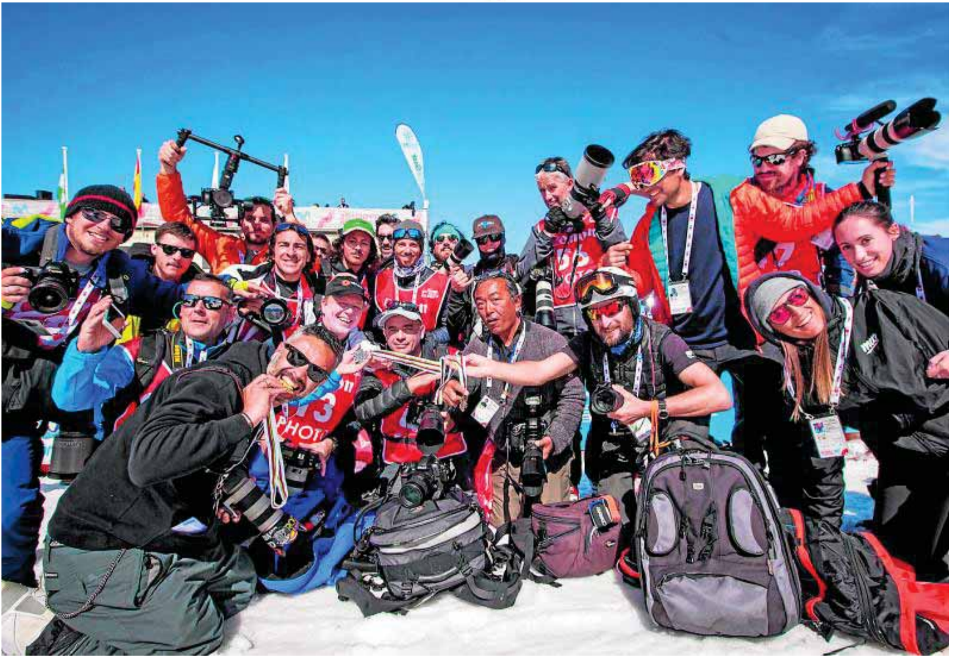
La mayoría del grupo de fotógrafos de prensa posan para una foto de familia, medallas incluidas.