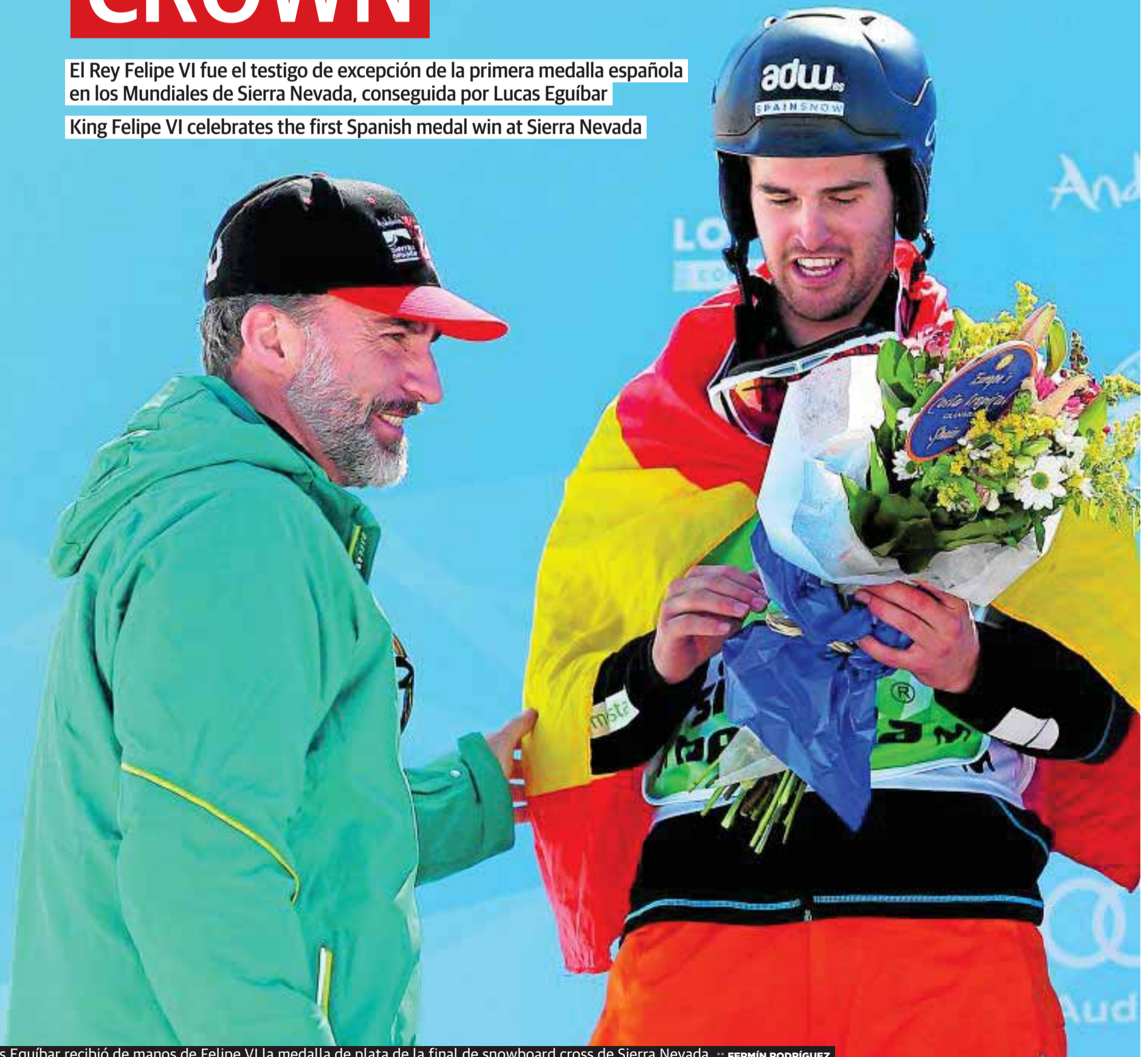
Lucas Eguíbar recibió de manos de Felipe VI la medalla de plata de la final de snowboard cross de Sierra Nevada.

King Felipe VI celebrates the first Spanish medal win at Sierra Nevada